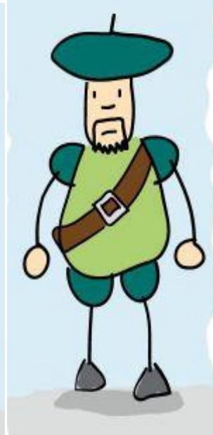
El bachiller Sansón Carrasco