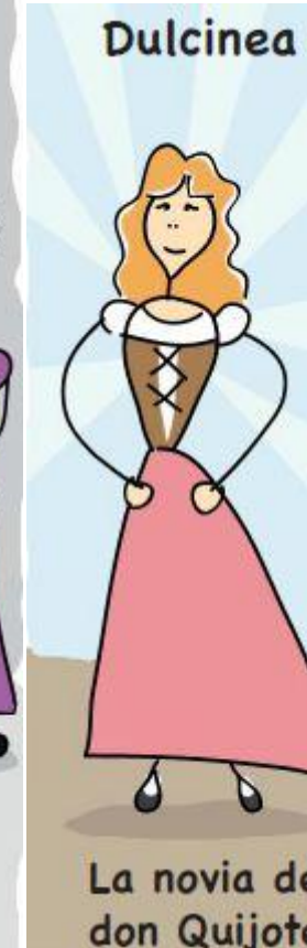
La novia de don Quijote