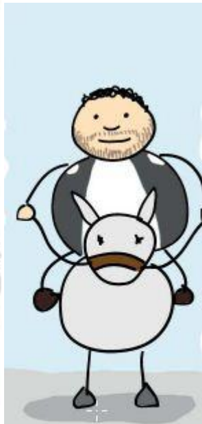
Sancho Panza y su asno