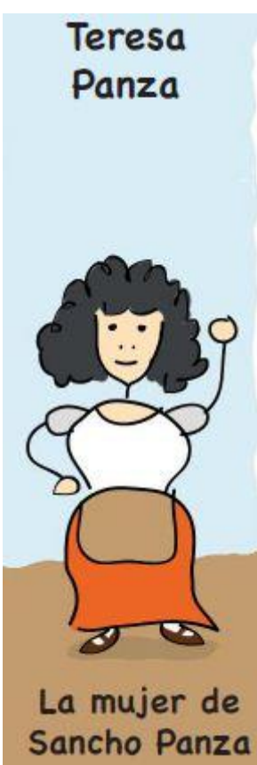
La mujer de Sancho Panza