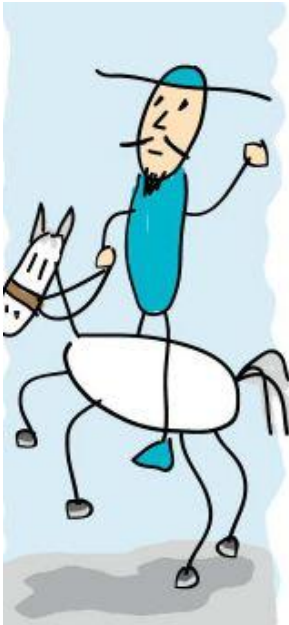
Don Quijote y Rocinante